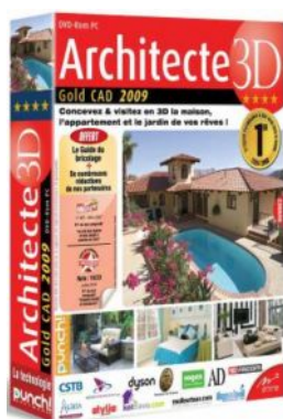
Architecte 3D Gold CAD