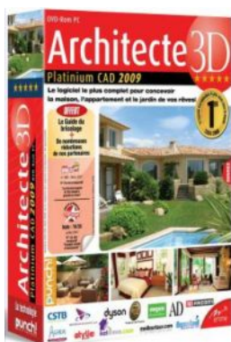
Architecte 3D Platinum CAD

En France, 4 versions de Punch ! Architecte 3D sont disponibles :