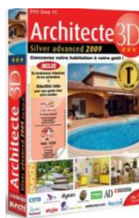
Architecte 3D Silver Advanced