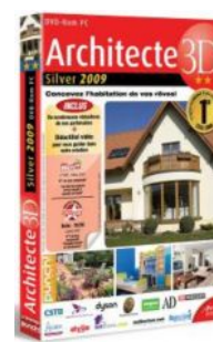
Architecte 3D Silver