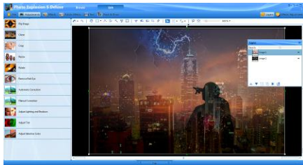
Photo Explosion utilise l'accélération de la carte graphique du PC pour les rendus, ce qui permet une prévisualisation immédiate des effets appliqués et réduit considérablement le temps d'édition des photos.

Photo Explosion gère les calques pour toutes les opérations de retouche qui les nécessitent, mais le logiciel a été conçu pour les rendre totalement invisibles pour le photographe amateur. Evidemment l'expert peut y accéder d'un simple clic, mais dans l'immense majorité des cas, Photo Explosion sait les faire totalement oublier.