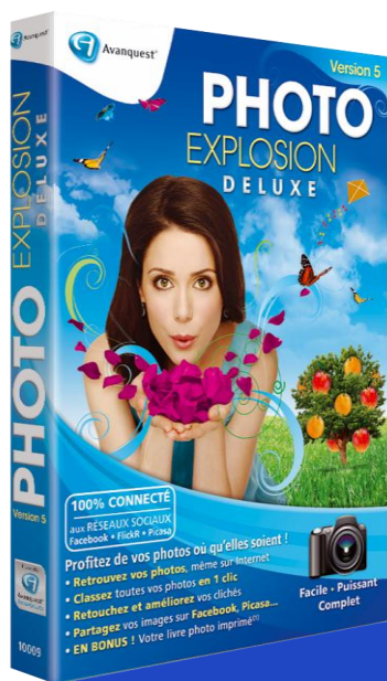
Photo Explosion Deluxe

Le studio photo connecté pour gérer tous ses souvenirs numériques, les retoucher et les imprimer en un seul clic !